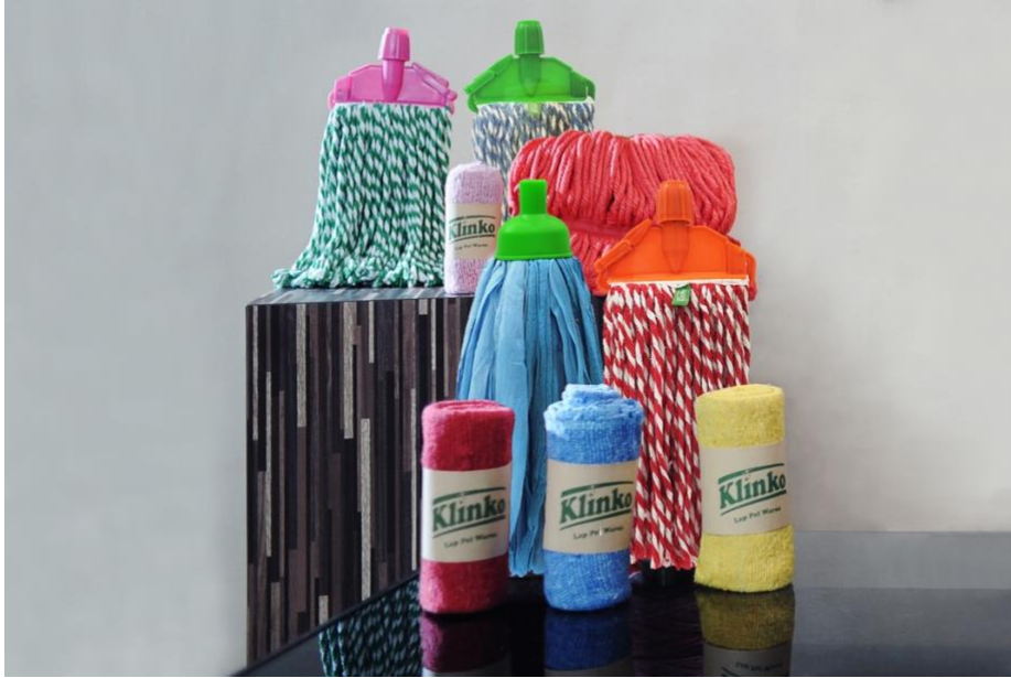
Caption Foto: Filosofi dan Tagline Klinko “Cleaning with Colors” terwujud pada produk-produk Klinko yang hadir dalam aneka warna.