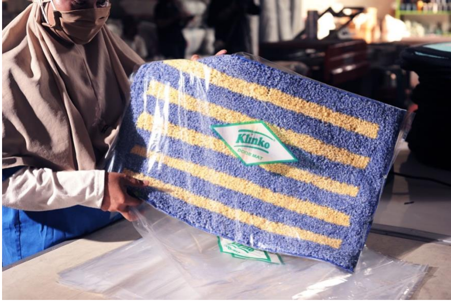
Caption Foto: Salah satu produk andalan pelanggan retail Klinko, Kaset Wool, yang tersedia dengan warna-warna variatif dan menarik.